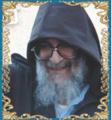
הרב אלעזר אבוחצירא כ"ז תמוז תשע"א (2011) "בבא אלעזר" בנו של רבי מאיר אבוחצירא ונכדו של הבבא סאלי